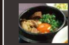
Stewed beef tendon-rice in a hot stone bowl